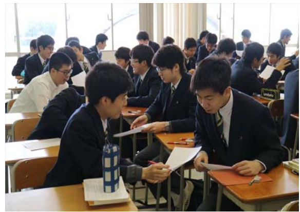
写真 4 1 週目の授業 (2015 年 4 月 9 日) [左] (高校 1 年) 英語 I [右] (高校 1 年) 古典

AL 推進委員は、このような写真をメーリングリストに添付して報告し、生徒たちがさほど臆することもなく元気よく 1 週目の AL に参加したことを報告した。「これで行けるぞ！」と少し見通しが立ったことを今でもよく覚えている。