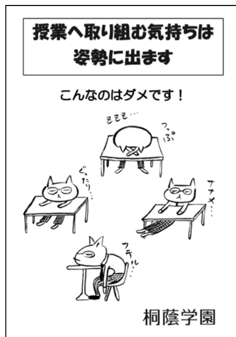
図 2 姿勢ポスター