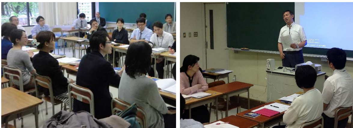
写真5 中学1年担当教員へのAL研修(2015年4月22日)

4月22日には、遅ればせながら、中学1年のAL推進委員の研修もおこない、同様にAL型授業推進のコツや問題点を共有した(写真5)。これ以降のAL推進委員の研修は、中学1年と高校1年合同でおこなった。5月の連休には、ALに関連する基本資料を何本か読んでおくことを宿題として課した。