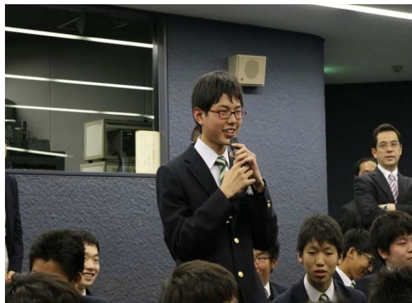
写真3 高校1年生へのオリエンテーション・AL体験 (2015年4月7日)