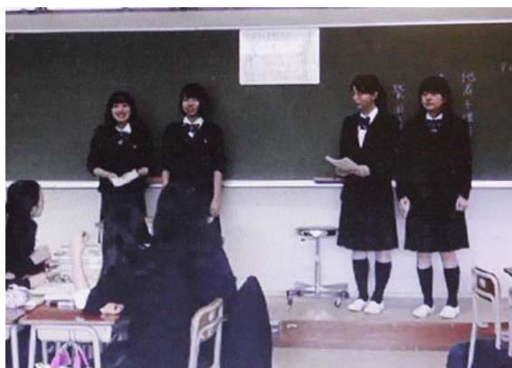
写真9 前出てきて発表

実は、「前出てきて発表」は、4月の授業開始期には計画されていなかった。3月末、4月の研修ではALの基本的技法として、「授業開始時のウォームアップ」や「ペアワークやグループワー