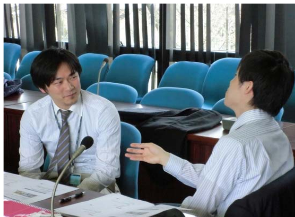
写真2 AL推進委員を対象とした研修合宿 (2015年4月1日)