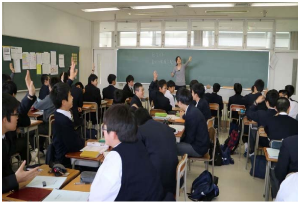
写真 4 左 は、1 週目の (高校 1 年) 英語 I の授業で、課題 (好きなスポーツ選手について日本語でまず話し、次いで英語で原稿を書く) の前にどちらが先に話すかの確認をとるべく、「生徒に手を挙げさせ」ている場面である ( YouTube ビデオ 0:53~ )。生徒たちははっきり手を挙げて、この後のグループワークに元気よく入っていった。 写真 4 右 は、(高校 1 年) 古典の授業で、一方の生徒が他方の生徒に古文口語訳小テストの解説をしているところである。

こうして桐蔭学園・AL 型授業が開始された。以下は、ML からの報告の一部である。