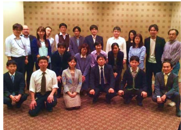
写真 1 AL 推進委員を対象とした研修合宿 (2015 年 3 月 27 日)

2 日間の研修では、一人ひとりが AL に対してどのように理解し疑問を持っているかを出し合い、共有をし、率直に議論をおこなった。ここにはかなりの時間を割いた。というのも、現場の教員が本気で取り組むためには、上からの通達で十分であるはずがなく、この改革が重要だと彼らが心から理解する必要があるからである。100%理解できなくても、自らの推進となる程度には理解する必要がある。そして、この議論の過程で、「授業開始時のウォームアップ」「ペアワークやグループワークのしかた」「前出てきて発表」という、AL の基本的な技法を体験的に演習した。教員同士で「こうやったらいいんじゃないかな」と教え合い、懇親会もおこない、1 つでも疑問を解決しようと議論を続けた。最後は教科ごとに集まって、4 月からどのように教材を AL 型にしていくか、教科固有の検討をおこなって合宿研修を終えた。