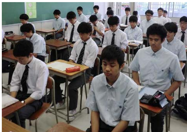
写真 6 姿勢を正して黙想